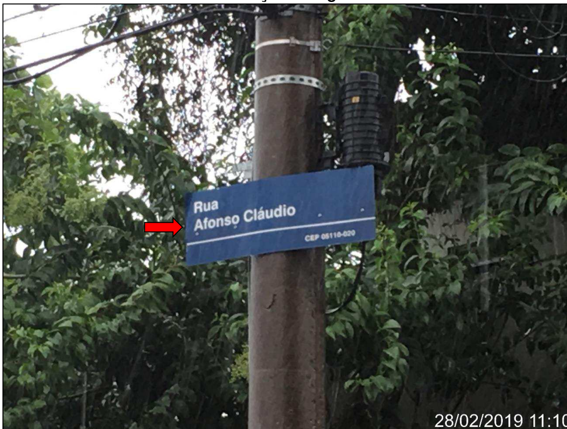
Foto 01: Identificação da Rua Afonso Cláudio onde se localiza o imóvel avaliando.