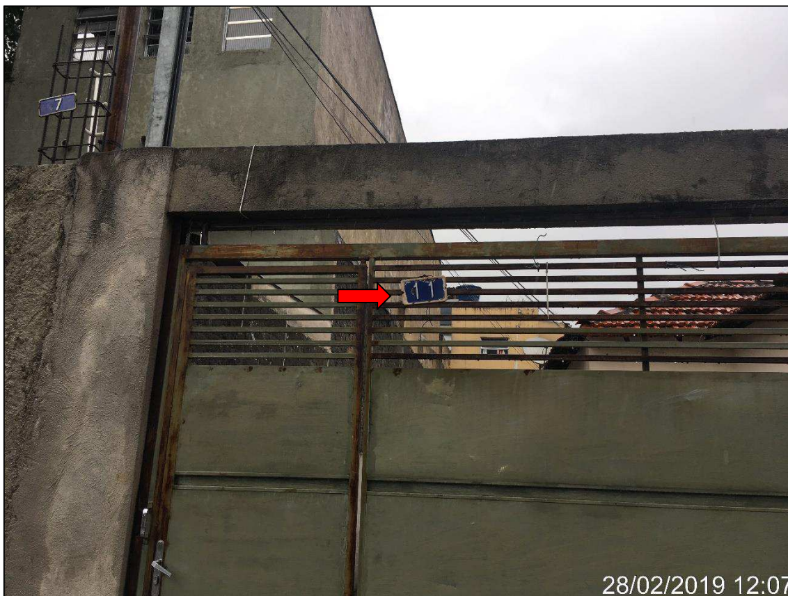
Foto 02: Identificação do imóvel avaliando nº11 - 19 da Rua Afonso Cláudio .

Endereço Eletrônico: andreaaclima@hotmail.com Telefones: (11) 9 8259 6539